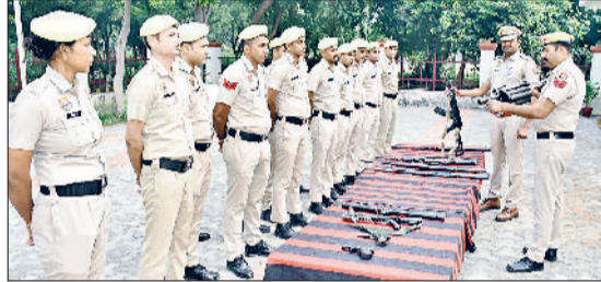
झज्जर। आधुनिक हथियारों की जानकारी देते हुए पुलिसकर्मी।