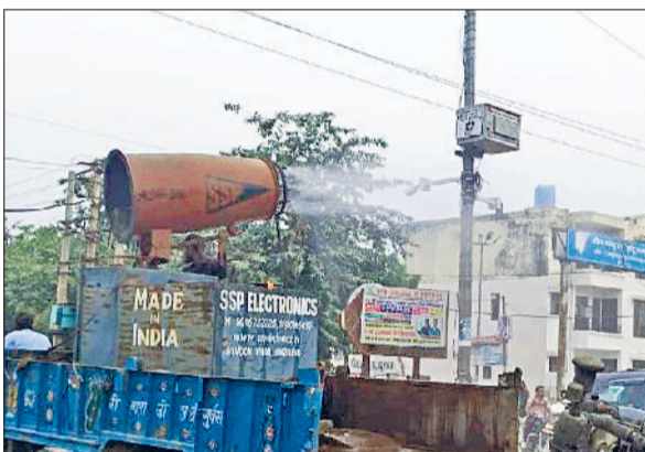
बहादुरगढ़। वीरवार को सड़कों पर तेनात एंटी-स्मॉग गन।

हवा की रफतार घटने और वातावरण में ठहराव आने से प्रदूषक कण नीचे जमने लगे हैं, जिससे सांस लेना भी मुश्किल हो गया है। दरअसल, हवा की गति 6 से घटकर 2 किलोमीटर प्रति घंटा रह गई है, जिसके कारण धूल और धुएँ के कण ऊपर नहीं उठ पा रहे। इससे शहर का वायु स्तर तेजी से बिगड़ रहा है।