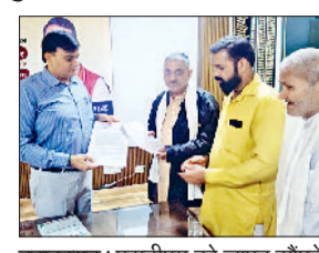
बहादुरगढ़। एसडीएम को ज्ञापन सौंपते पंजीकृत सब्जी विक्रेता।