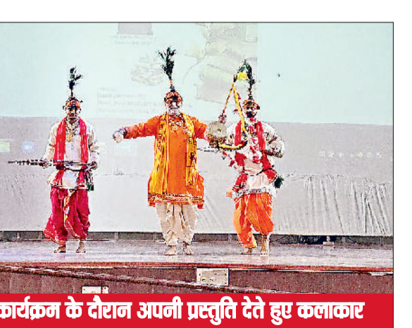
कार्यक्रम के दौरान अपनी प्रस्तुति देते हुए कलाकार

नेहरू महाविद्यालय में वक्ताओं ने हरियाणा की पहनावे और जीवनशैली से करवाया रुबरु विशिष्ट पहचान के लिए जानी जाती है और ग्रामीण बोली की मिठास अनुपम है। हरियाणा का पारंपरिक पहनावा और जीवनशैली देखकर मन में गर्व की अनुभूति होती है। उन्होंने कहा कि हमें अपनी लोक संस्कृति के संरक्षण और संवर्धन के लिए निरंतर प्रयास करते रहने चाहिए।