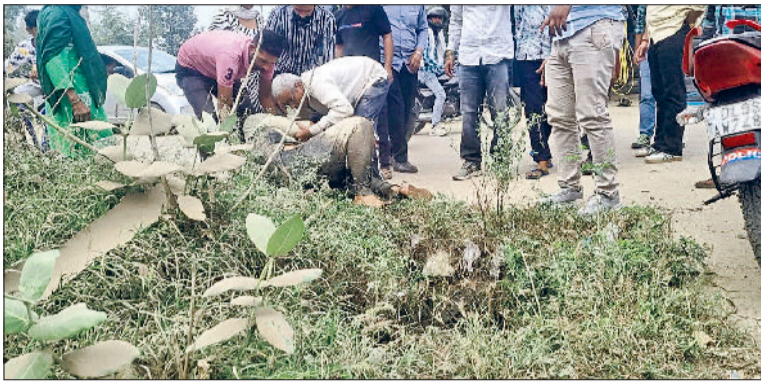
बहादुरगढ़ में नजफगढ़ रोड पर खुले नाले में गिरे बाइक सवारों को सभालते स्थानीय नागरिक।

इस घटना पर लोगों ने प्रशासन के प्रति नाराजगी जताई। लोगों ने कहा कि शहरभर में नालों की हालत बेहद खराब है। कई जगहों पर नाले बिना ढक्कन के खुले पड़े हैं। आए दिन लोग और पशु घायल हो रहे हैं। नाले में गिरकर लोगों की जान तक जा चुकी है। मौके पर मौजूद भाजपा नेता जसबीर सैनी ने कहा कि खुले नालों के कारण शहर की छवि खराब हो रही है और लोगों की जान खतरे में है। आए दिन हादसे हो रहे हैं। जनप्रतिनिधियों और प्रशासन को इस तरह ध्यान देना चाहिए। सभी नालों को ढकने व सफाई की व्यवस्था दुरुस्त करनी चाहिए।