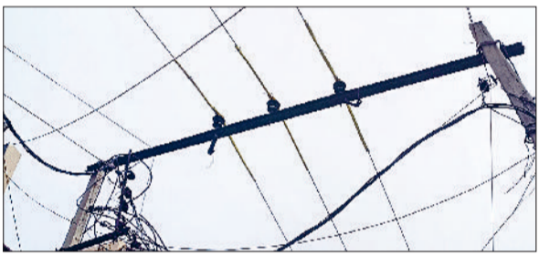
बहादुरगढ़। हाइड्रेशन लाइन पर चढ़ाई गई स्तंभ।

मांडोटी बाजार से बिजली की हाइड्रेशन लाइन गुजर रही है। यह लाइन दोनों तरफ लगे पोल पर टिके लोहे के एंगल पर लटकी है। अक्सर बंदर एक से दूसरी छोर जाने के लिए इन लोहे के एंगलों पर चढ़ जाते हैं और हाइड्रेशन लाइन की