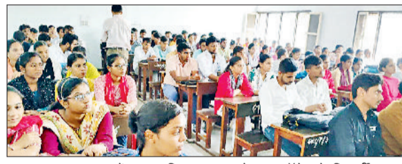
बहादुरगढ़। व्याख्यान में साइबर टिप्स प्राप्त करते छात्र कॉलेज के विद्यार्थी।