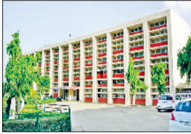
झज्जर। राजकीय बहुतकनीकी संस्थान का फाइन फोटो।

■ बेटी से शोषण की 20 जून को पीएम को भेजी थी शिकायत