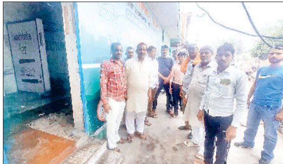
झज्जर। शौचालय के बाहर एकत्रित दुकानदार।