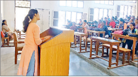
झज्जर। तात्कालिक भाषण प्रतियोगिता में भाग लेती छात्रा।